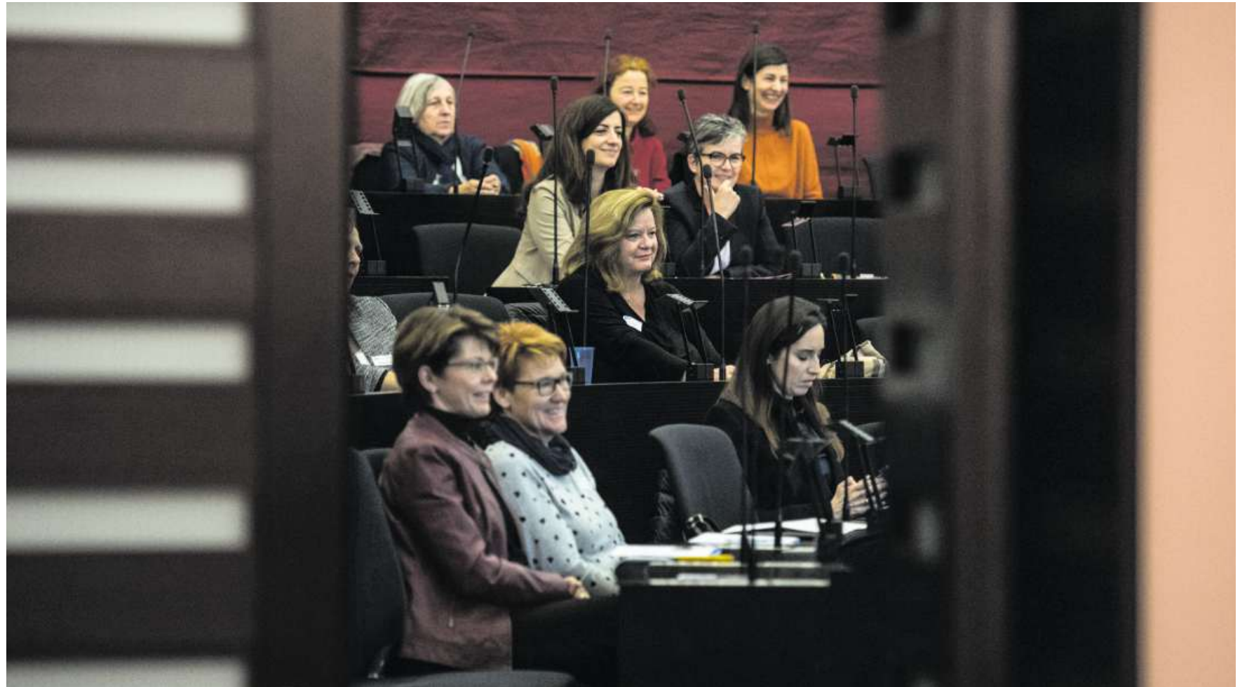
Viele der 315 Kandidatinnen haben gestern auf Einladung von «Frauen Luzern Politik» ein erstes Mal im Kantonsratssaal Platz genommen. (28. Januar 2019)

Ausschlaggebend für die Verteilung der 120 Sitze ist die ständige Wohnbevölkerung. Weil der Wahlkreis Sursee zwischen 2014 und 2018 überdurchschnittlich stark gewachsen ist (7,1 Prozent), gewinnt er auf Kosten des Wahlkreises Luzern-Stadt (1,1 Prozent) einen Sitz. So ergibt sich folgende Verteilung: